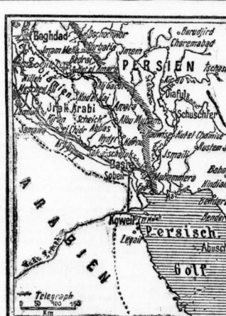
Die englisch-türkischen Kämpfe in Mesopotamien