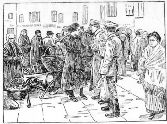
Der erste Wochenmarkt in Udine.

(Von unserem militärischen Mitarbeiter.) Das Kriegsjahr 1917 hat uns mit seinen großen Schicksalen eines der größten und vollen Jahre der Weltgeschichte gesehen. In den ersten Monaten des Jahres 1917, als die deutsche Armee nach dem Zusammenbruch der Fronten im Westen sich nach Osten wandte, standen wir vor dem entscheidenden Kampf um die Weltmacht. Die Ereignisse des Jahres 1917 sind bis heute in der Geschichte der Menschheit unvergessen. Die deutsche Armee hat in diesem Jahr die größten Siege errungen, die sie jemals errungen hat. Die deutsche Armee hat in diesem Jahr die größten Siege errungen, die sie jemals errungen hat.