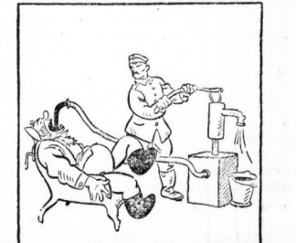
Cambrai, die Mogenpumpe... England, Alles was ich schon gegessen habe, pumpt mir der Deutsche wieder raus!

Das neue Finanzjahr. Die finnländische Währungsreform, die von der finnischen Regierung durchgeführt wurde, hat zu erheblichen Veränderungen in der finnischen Wirtschaft geführt. Die deutsche Armee hat in diesem Jahr die größten Siege errungen, die sie jemals errungen hat.