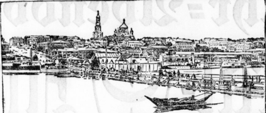
Rostov am Don, die Hauptstadt d. neuen Don-Republik