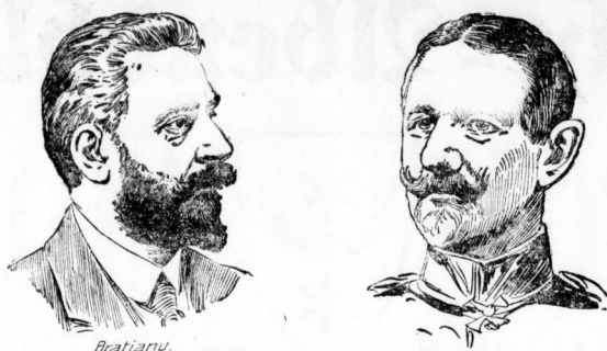
Bratiano, rumänischer Ministerpräsident