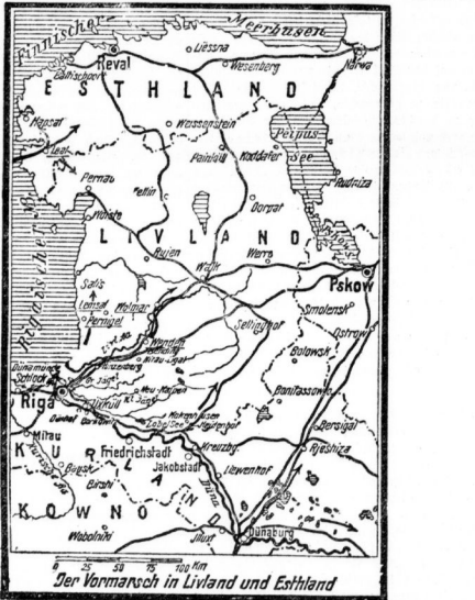
Der Varmarsch in Livland und Estland.