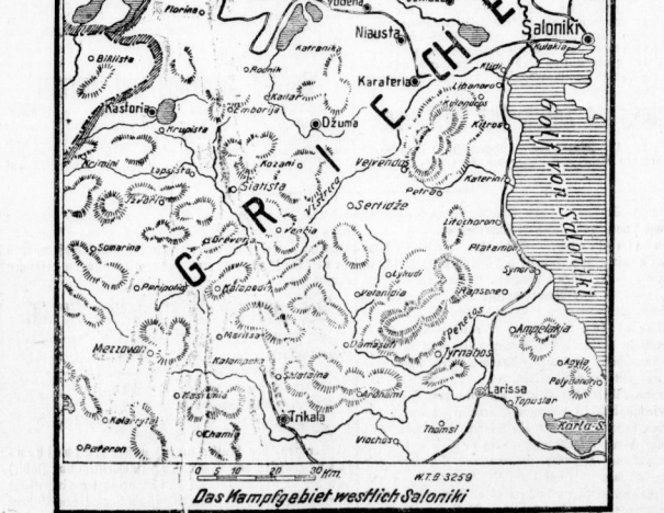
Das Thraciengebiet westlich Saloniki