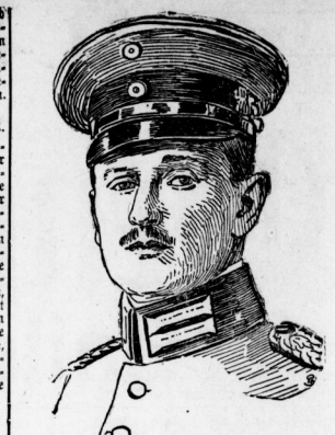
Prinz Heinrich von Bayern.