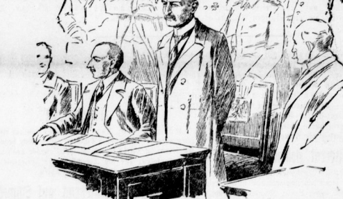
Der neue Reichsminister Dr. Michaelis hält am 19. Juli seine Antrittsrede im Reichstag.