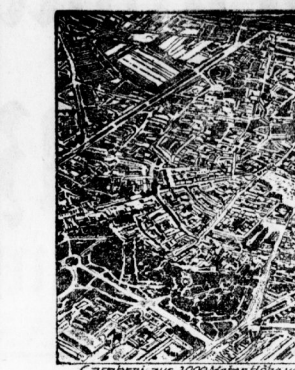
Cambrinus, aus 2000 Meter Höhe von einem deutschen Flieger aufgeflogen