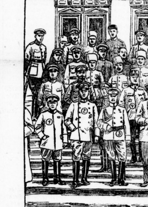
Die Wiffensreise auf der russisch-englischen Front. Ein Bild, das die Zusammenarbeit zwischen den Alliierten zeigt.