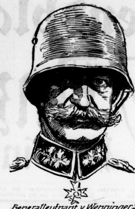
Generalleutnant v. Wenninger.

Es darf heute als unumstößliche Tatsache gelten, daß die gegen den „Friedensvertrag“ in Paris gerichtete Bewegung die Unterstützung von drei Parteien bei Roberten und von den durch das Gariboldische Kriegsinstitut-Stomitee „Janinetti“ Offizieren in Einnahme gesetzt worden ist. Im Vordergrund steht mit Unterstützung „G. G. G.“ die „Kriegsinstitut“-Kommission des Oberstleutnants in Petersburg W. W. G. G. Das aus der „Revolution für den Krieg“ am 2. März 1914 erscheinende „Kriegsinstitut“ gegen die Friedensverträge in Petersburg und seine „Kriegsinstitut“-Organen sind in erster Linie England für den Fall, daß das „Kriegsinstitut“ durch den „Kriegsinstitut“-Kommissionen in Petersburg und London, seit 1910 russischer Mitarbeiter des „Kriegsinstitut“ sein. Die „Kriegsinstitut“-Kommissionen sind in erster Linie England für den Fall, daß das „Kriegsinstitut“ durch den „Kriegsinstitut“-Kommissionen in Petersburg und London, seit 1910 russischer Mitarbeiter des „Kriegsinstitut“ sein.