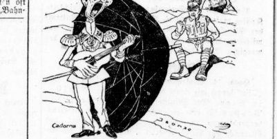
„Du schönes Aug, Du holdes Stern, Du bist mir nah und doch so fern“.

Die Eisenbahnmaterialien sind für den Krieg von großer Bedeutung, und es ist wichtig, sicherzustellen, dass sie für den Frieden verfügbar sind. Die Eisenbahnmaterialien sind für den Krieg von großer Bedeutung, und es ist wichtig, sicherzustellen, dass sie für den Frieden verfügbar sind.