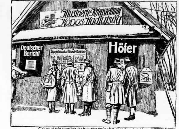
Eine österreichisch-ungarische Feldredaktion.

Die Entente selbst, die im ersten Stadium des Krieges notwendig waren — nur jenen — aber immer beständiger wieder an die Oberfläche traten, je unglücklicher der Kampf wurde und je fester die Stoff des Vorkrieges an allen Ecken und Enden.