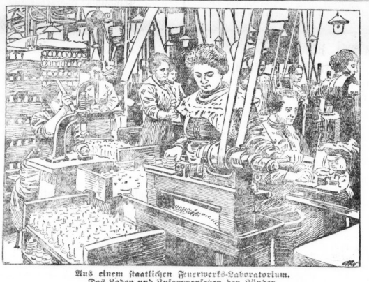
Ein neues kaiserliches Feuerwerks-Laboratorium. Das Leben und Zusammenleben der Länder.

1. Mai vertrieben 2 Schiffe nach auf etwa 20 Millionen Tonnen veranlagt, wozu die englische Flotte mit mindestens 14 Millionen Tonnen beisteuert. Das ist ein Verstoß, den das England nicht länger aushalten kann, weil es weit mehr als irgend ein anderes Land auf überseeische Schiffe angewiesen ist. Die Eingriffe der englischen Flotte in die österreichische Seemacht sind ein Verstoß, den das England nicht länger aushalten kann.