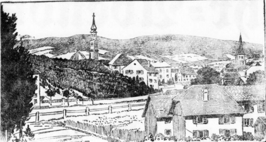
Ansicht von Schlegien (Asiago)