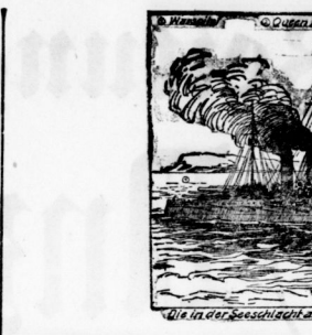
Wie in der Seeschlacht am 1. Mai an der Dänischen Küste vertrieben englischen Kriegsschiffe.