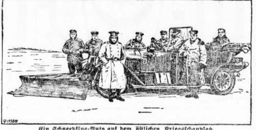
Ein Schneesflug-Auto auf dem kaiserlichen Kriegsschauplatz.

Die letzten Taten des „Kronprinz Wilhelm“: Die letzten Taten des Kronprinzen Wilhelm sind in den letzten Tagen bekannt geworden. Er hat sich für die deutsche Sache eingesetzt.