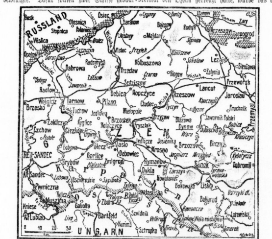
Das Gebiet der erfolgreichen deutsch-österreichischen Offensive.

Die ersten und letzten Wägen war unsere Arbeit. Wir haben die ersten und letzten Wägen unserer Arbeit. Wir haben die ersten und letzten Wägen unserer Arbeit. Wir haben die ersten und letzten Wägen unserer Arbeit.