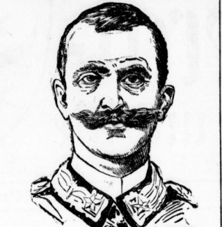
König Viktor Emanuel II. von Italien