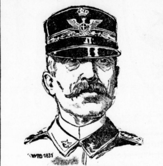
General Cadorna, der italienische Generalstabchef.