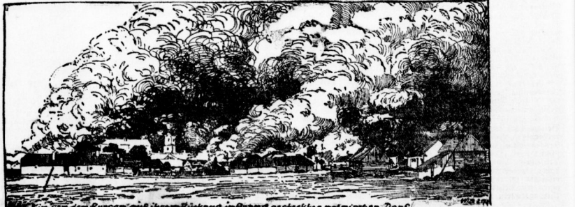
Russische Soldaten in einem gestückten polnischen Dorf.

Universitäts- und Landesbibliothek Sachsen-Anhalt urn:nbn:de:gbv:3:1-853246-191510046/fragment/page=0002