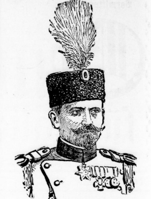
General Guro Babovic, der neue serbische Generalstabschef.

Wir haben durch die Unentschiedenheit. Die Feinde sind in großer Zahl getötet. Die Serben sind in großer Zahl getötet.