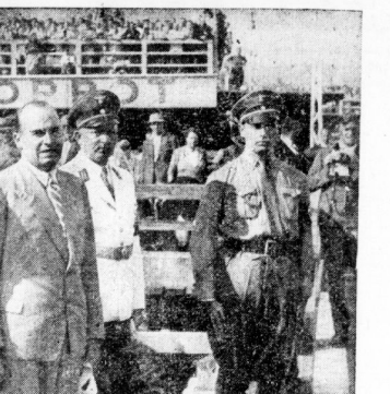
In Zoppot findet gegenwärtig, wie bereits berichtet, die Osttagung der Deutschen Reichswärmer statt, bei der Reichsminister Dr. Frank Ausführungen zu dem Thema „Der Kampf Danzig — Ein Rechtskampf“ machte. Unser Bild zeigt Reichsminister Dr. Frank nach seiner Ankunft am Seesteg in Zoppot. Näheres über den Kongreß s. unseren Eigenbericht im politischen Teil.

Ein andres nicht weniger wichtiges Kapitel auf dem Gebiet der Wetterbeeinflussung sind jene eigenartigen Erscheinungen, die der Stöm im Menschen hervorruft. Immer wieder erlebt man es in den Abgeschiedenen, daß es vor und während des Einbruchs der kalten Winter nichts als viele frische und milde Menschen gibt wie dort. Nichts will an einem solchen Tage gelingen, Mühseligkeit und Unglück erreicht und weiter, Traurigkeit und Verdrüsslichkeit, wobei man sich und heftig. Wenn auch die Überlebensfähigkeiten der Meteorologen schon längst kein Geheimnis mehr bietet, so ist man dem Rätsel, warum die warmen Hallen der Mensch und Tier mehr oder weniger stark gesundheitsschädlich sind, bei besonders empfindlichen Naturen sogar Krankheiten hervorzuveranlassen, noch längst nicht auf dem Spur gekommen.