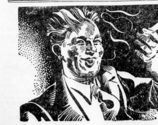
Ein Wanderer, der beim Sturz auf einen eisernen Nagel aufgespießt wurde.

Altenbrunn, 22. August. Ein Wanderer stürzte bei der Befreiung eines Grabsteins und fiel auf dem Kopf auf einen eisernen Nagel, wodurch er schwer verletzt wurde.