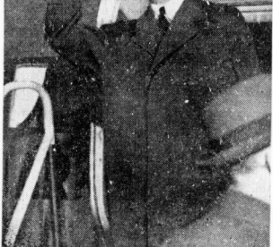
Reichsaußenminister von Ribbentrop, der gestern vom Flughafen Tempelhof nach Moskau abging.

Zie war sehr erkrankt zu hören, daß er schon drei, viermal verheiratet gewesen war. Aber diese Ehen waren durch den Tod der Frauen zufällig beendet. Immerhin unterwarf man die Frau einem eingehenden Verhör, um genauere Angaben über ihren Mann zu erhalten.