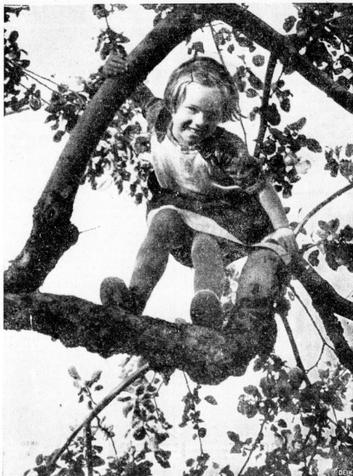
Ob die Äpfel schon reif sind?