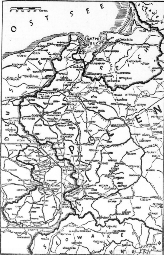
Karte unserer Grenzen um Polen. Die schraffierte kennzeichnet die Vorkriegsgrenze.