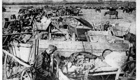
Nach einem heftigen Angriff der deutschen Truppen verließ ein polnisches Retterregiment sein vor Granden aufgeschlagenes Lager in wilder Flucht. Das gesamte lahrende Material wurde von ihnen zurückgelassen.

Der bisherige Ministerpräsident der Südafrikanischen Union, General Herzog, protestiert in einer öffentlichen Erklärung gegen die Aufnahme der Union in den europäischen Krieg. General Herzog protestiert in einer öffentlichen Erklärung gegen die Aufnahme der Union in den europäischen Krieg.