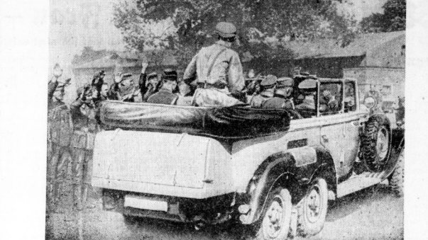
Vom Führerhauptquartier aus unternimmt der Führer und Oberste Befehlshaber der Wehrmacht an jedem Tag Flüge oder Fahrten, die ihn in die vordersten Linien zu seinen Soldaten führen. Wo immer die Soldaten dem Führer begegnen, jubeln sie ihm begeistert zu.

Der Held der Schlacht. Schon viele Stunden liegen sich die beiden Gegner mit einer großen und verbissenen Entschlossenheit gegenüber. Der Pole weiß es nicht diesmal um die Entscheidung. Ein Anschlag wird ihm mehr möglich, das einzige, was gelingen könnte, ist ein Durchbruch. Wohl sind die polnischen Streitkräfte zahlenmäßig der deutschen überlegen. Der Anschlag wird entsetzt durch die deutsche Luftwaffe aus ihren Maschinen. Gewöhnlich im Zerstörer aus nur zehn Meter Höhe fliegendes Feuer auf die letzten verbleibenden Truppen eröffnet. Ist die ganze polnische Artillerieabteilung schon vernichtet durch den Anflug einer einzigen deutschen Kette.