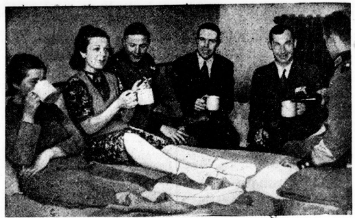
In Brest-Litovsk wurden von den deutschen Truppen nach der Einnahme neben zahllosen Flüchtlingen auch fünf amerikanische Staatsbürger — drei Männer und zwei Frauen — angetroffen, die sich auf der Flucht vor den Polen aus Warschau befanden. Sie hatten tage- und nachtelang zu Fuß in ständiger Angst vor den polnischen Mordbanden die Wälder durchstreift. Unser Bild zeigt die amerikanischen Flüchtlinge in einem Lazarett zu Brest-Litovsk, wo sie zur Heilung der wunden Stellen die pflegerische Behandlung, die ihnen allen seitens der deutschen Truppen entgegengebracht wird.

Das Banu-eisler: Strahlige. Die Ruinen sind heute noch zu sehen. Die Ruinen sind heute noch zu sehen. Die Ruinen sind heute noch zu sehen.