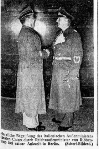
Herzliche Begrüßung des italienischen Außenministers Graf Ciano durch Reichsaussenminister von Ribbentrop bei seiner Ankunft in Berlin.

Kriegsmarine gemeinsam vorbereiteter Angriff durchgeführt wurde. Die Besetzung von 52 Offizieren, darunter der polnische Flottenchef Konradmiral von Unruh, und 4000 Mann werden heute vormittag in die Waffen strecken. Ein britisches Anfliegergeschwader wurde in Polen abgefangen.