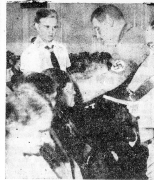
Bei der Verleihung von Ehrenkreuzen an kinderreiche Mütter.

Die Mütter-Chrentrenze ist ein Zeichen der Anerkennung für die Mütter, die ihre Kinder großzuziehen. Die Polizeidirektion empfiehlt, die Mütter-Chrentrenze zu unterstützen.