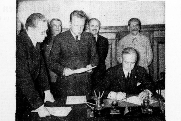
Die Unterzeichnung des deutsch-russischen Freundschaftsvertrages in Moskau. Unser Bild zeigt Reichsaußenminister v. Ribbentrop...