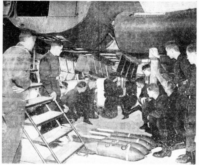
Hier wird „Bombenabwurf“ geübt, um die Lehrgangsteilnehmer mit dem Mechanismus des Abwurfapparates vertraut zu machen.