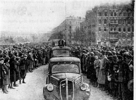
Mit den deutschen Truppen kamen auch deutsche Lausprecherwagen in die ehemalige Hauptstadt Polens.

Vasalgieren besaunt, ein paar Stunden um das Schiff. Schnell sind die Normalitäten mit dem Kapitän erledigt. Das Untersuchungsamt tritt aus dem Boot. Die Besatzung ist sehr freundlich und hilfsbereit. Die Booten sind in großer Anzahl auf dem Meer zu sehen. Die Boote sind in großer Anzahl auf dem Meer zu sehen. Die Boote sind in großer Anzahl auf dem Meer zu sehen. Die Boote sind in großer Anzahl auf dem Meer zu sehen.