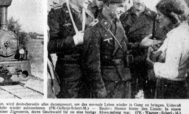
Links: Kaum sind die militärischen Maßnahmen beendet, wird deutschseits alles daran gesetzt, um das normale Leben wieder in Gang zu bringen. Ueberall ist die deutsche Verwaltung dabei, den Eisenbahnverkehr wieder aufzunehmen. (PK-Gelber-Scherl-M). Rechts: Hinter den Linien: In einem Quartier in Polen begegneten diese Panzerfahrer einer Zigeunerin, deren Geschwafel für sie eine lustige Abwechslung war. (PK-Wagner-Scherl-M)

Der Vulkan im Gilienischen Meer ist wieder in Tätigkeit getreten. Die Vulkan im Gilienischen Meer ist wieder in Tätigkeit getreten.