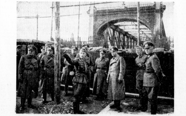
Der Oberbefehlshaber des Heeres im Westen Generaloberst v. Brauchitsch während seines Besuches im Frontabschnitt Oberheim...