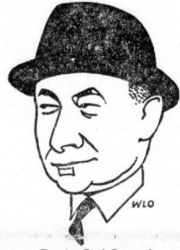
Das ist Paul Reynaud, Frankreichs Finanzminister...