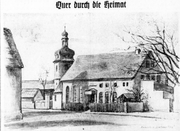
Motiv aus Zacheren: Gasthof „Zum treuen Herz“ (Zeichnung: Marholz)