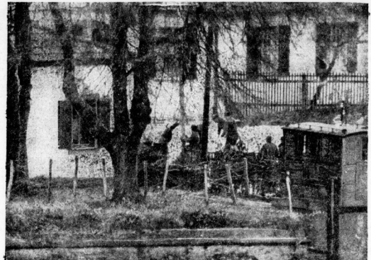
An der deutschen Westfront wurde mit einer Fernkamera diese bemerkenswerte Aufnahme über den Rhein gemacht. Das Auge der Kamera entdeckte dabei, wie unser Bild zeigt, französische Soldaten beim Bau von Telefonleitungen.

muß sie tragen und aufnehmen, die das alles für ihr Besten angesehen haben. Sie wissen, daß es notwendig ist. Sie wissen, daß die Schlüssel zu ihrem Hab und Gut den Händen deutscher Offiziere anvertraut sind. Sie wissen, daß jeder, der sich an ihrem Eigentum vergräbt, ohne Gnade dem härtesten Kriegsgefecht verfallt. Und sie wissen wohl auch, daß zwischen dem Feind und ihren Häusern und Höfen und Gärten der deutsche Soldat im Geheimen liegt. Teils vor, teils hinter der Erde, die Welten von Krieg und Frieden überdeckt, arbeiten in ihren Unterfluren die Stäbe. Die Unterfluren der Stäbe werden, nach vorn zu, immer beschleunigter und beengter . . . Aber das liegt in der Natur der Sache und ist ebenfalls nur dem Frontschweigen vom im Dunkeln ein humoristisches Necht, vom ganz hohen Stab als von der „Gasse“ zu sprechen. In Wirklichkeit ist der Stab natürlich selbst ein Teil der Truppe, der seine ununterbrochene Arbeit und Mühsal tut. Eine dauernde verlässliche Kontakt mit der Front ist das gar nicht möglich. Bei einem unzeitigen Sturz zu den vorderen Verbänden habe ich zweimal den Kommandierenden General des betreffenden Abschnitts getroffen. Die Front war zu geben zu seinen Männern — nachzusehen, wo es fest, und nachzusehen, wo sie allein nicht mehr weiterkommen: das war die Dersensache und Fernsicht dieses Generals. Er hatte gültige Blauze Augen. Und war doch ein ganzer Mann und Soldat.