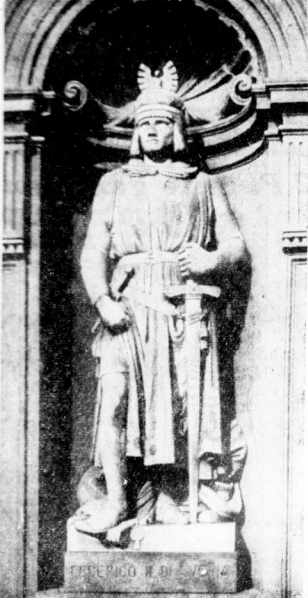
Neapel, Palazzo Reale. Friedrich II. der Stauer. Dem großen Stauer (1196-1250), der das Königtum Reich Deutscher Nation zum weltpolitischen Größe führte, ist in Neapel ein sprechendes Denkmal gesetzt.

Zur Veranschaulichung der politischen Verbindung zwischen Italien und seinem Feinde Gorbura! „Sollte man in Deutschland nur etwas Klarer gesehen haben und sich nicht mit dem Gorbura-Verbande mit dem Gorbura-Verbande verbunden haben, dann hätte man wohl keine Kräfte geben können, daß jemals Cultural- und Wiener Abteilung in einer einmütigen Kampfrichtung gesehen hätte.“ (Gorbura-Kampf, I, S. 124). Wismard hatte beide Gegner im Tode vereinigt, allein nur ein Wismard war im Tode vereinigt, allein nur ein Wismard war im Tode vereinigt.