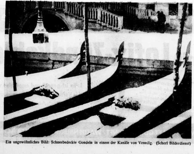
Ein ungewöhnliches Bild: Schneebedeckte Gondeln in einem der Kanäle von Venedig. (Scherl Bilderdienst)

Au Gegend, wo es besonders viele Analphabeten gibt, sind auf den Feldern Sandsteine das Bahnhofsrestaurant durch ein angedrucktes Brot, der Bahnhofsarzt durch einen Mann mit Hüftrohr