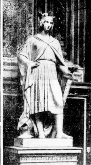
Neapel. Kirche S. Maria del Carmine. Standbild Konrads.

nicht nur die Schöpfer des alten, sondern auch die Träger des neuen Europa. Eine Nationalsozialismus und Nationalismus waren unter Autorität bereits im Chaos untergegangen. Heute sind alle limitierten Bindungen eines Römischen Reiches Deutscher Nation zwischen Deutschland und Italien zum Glück der beiden Völker gestiegen. In der gemeinsamen großen Gegenwart tritt die Kameradschaft der beiden Völkerrévolutionen, die bereits Geschichte gemacht und Europa neu gestaltet hat, tritt die langverheißene Gewissheit einer gemeinsamen großen Zukunft.