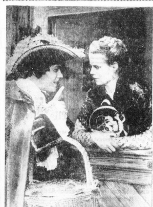
Die schöne Müllerin ist mittrauisch