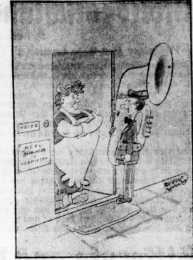
Die misstrauische Wirtin. „Oh, ich bin bestimmt ein ruhiger Mieter!“