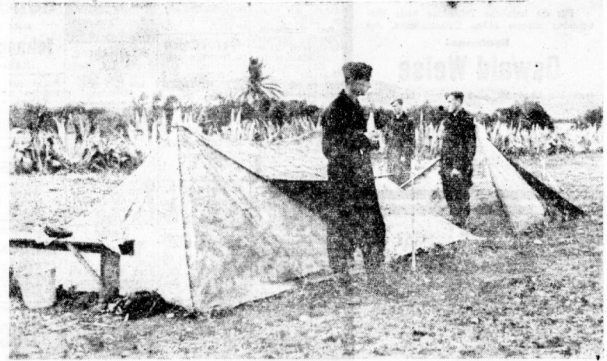
Deutsche Flieger unter südlichem Himmel

vollendete kleine Landschaftsbilder, in denen Meer und Sonne, schöngezeichnete Moten und die stille Majestät des Japans den Ton ansetzen. Und es gibt Szenen auf dem Schulhof zwischen weißen Wäfflertruppen, turnende Mädchen in Maroonblößen, marschierende Staben mit Schirmmützen auf dem Kopf.