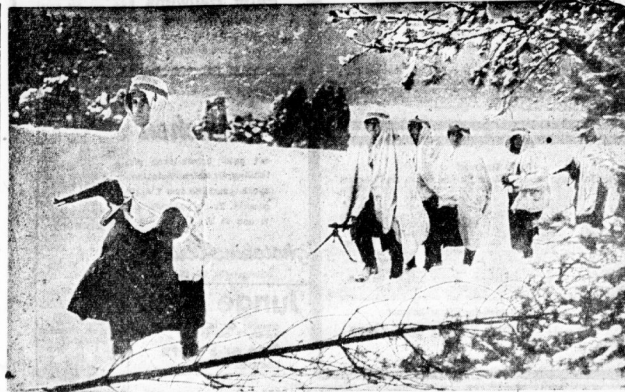
Gefechtsübung des Infanterie-Regiments „Großdeutschland“

Eine Einheitsübung in bergigem Gelände setzte, wie man sieht, die Ausbildung auch heute in Krisenzeiten, in denen in nicht die Monate und Jahre des Friedens zur Verfügung stehen, ist. Nach harten, in den Staffeln gut gelernt, die Panzer und auch die Sturmgeschütze, denen es der Parade, die kein Kommandeur bei der Namensgebung verweigerte, trenn war und trenn bleiben wird. So sagt auch das Merkblatt, daß bei