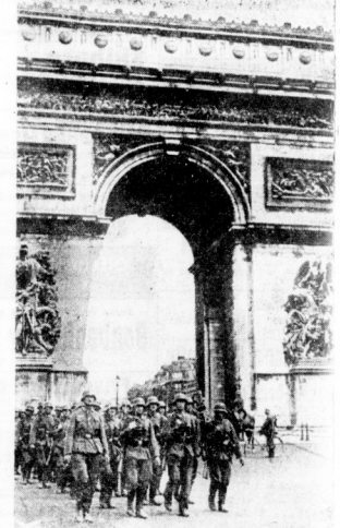
Arc de Triomphe: Einmarsch in Paris

Der Krieg gegen Frankreich war beendet, und es blieb allein der Kampf gegen den Neutralitäts-England! In die Zeite unserer Marine, die mit hartem Blockadenkrieg die Insel umflammerte, trat die deutsche Luftwaffe, die seit dem Zusammenbruch des vergangenen Jahres in sah painstlicher Polze ihre vernichtenden Schläge auf England heriederhaelt. Ich als Vergeltung für Churchill's nächste Luftangriffe auf friedliche deutsche Städte. Noch niemals in der Geschichte hat England einen Krieg so empfindlich in eigenen Lande gespürt wie diesen, und noch niemals sah es sich von einer so gigantischen Front bedroht wie der deutschen, die heute von Norwit bis zu den Pyrenäen reicht. In den Reihen unserer Wehrmacht markiert die nationalsozialistische Idee, ihre Siege sind zugleich Siege des Nationalsozialismus. Am