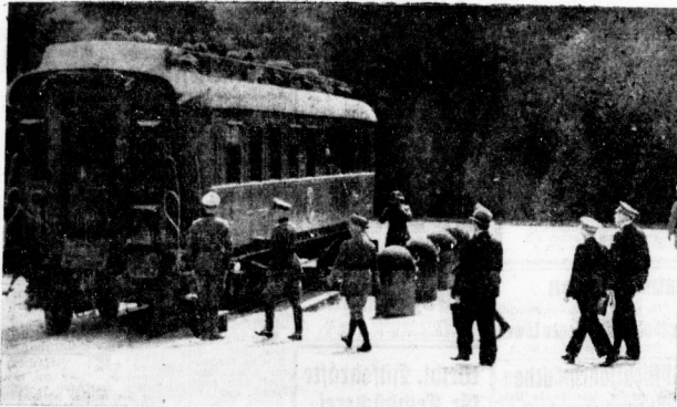
Compiègne 1940: Die französische Abordnung trifft ein

Nach lang dann in uns das Heldentum des Kampfes um Norwit nach, wo deutsche Fernrohr-Befreiungen und uniere Gefährtsflieger einer vielfachen britischen Hebermacht trotzen und sie endlich zum Niedergang zwangen, als eine neue schier überrollende Kunde uns erreichte: Einmarsch in Holland und Belgien zur Vereitelung eines durch Geheimabmachungen vorbereiteten feindlichen Einalles ins Ruhrgebiet! In fünf Tagen bereits mußte Holland kapitulieren, und folgte Schlag auf Schlag. Die Niederwerfung Belgiens, der erste Durchbruch durch die bis dahin für unangreifbar gehaltene Maginot-Linie, der Vorstoß zur Atlantik-Küste, Dünkirchen, Paris und endlich das Westfrontüberqueren Frankreichs! Ereignisse wurden wir alle dann am Handlungstagen Jener ersten Stunde im Walde von Compiègne, da in dem gleichen Eisenbahnwagen, der im November 1918 den Scheitern des unglücklichen deutschen Reiches weges zeichen hatte, der Führer sein einflussiges Wort einlöste und die Schmach von Versailles tilgte! Und wenige Tage später folgte jene erhabende nächste Stunde, da es über die Schladtsfelder Frankreichs und durch den Aelber über das ganze Großdeutsche Reich an uns kam: „Das Ganze hat!“