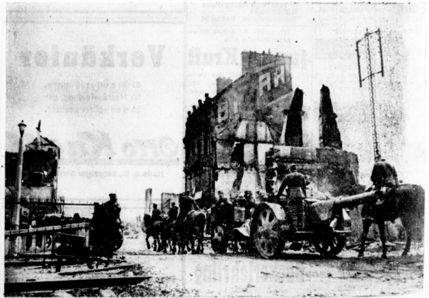
Auf dem Vormarsch in Frankreich