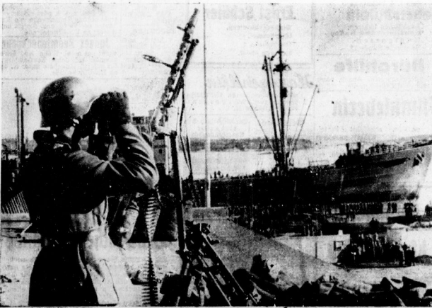
Norwegen: Landung deutscher Truppen