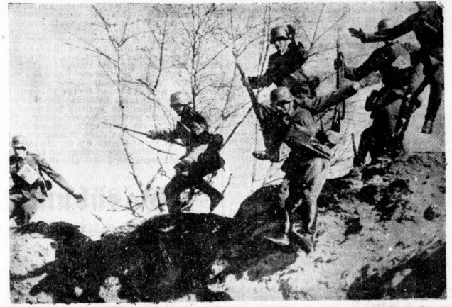
Schützengruppe beim Sprung Unermüdlich wird an der Vervollständigung der infanteristischen Ausbildung gearbeitet. — Unsere Aufnahme von einer Übung der Infanterie zeigt eine Schützengruppe beim Sprung über eine Höhe