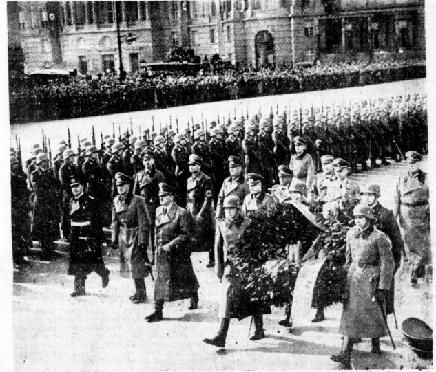
Der Führer am Heldengedenktage Das deutsche Volk beging gestern mit dem Führer die Gedenkstunde für die gefallenen Helden. Im Zeughaus in Berlin fand die große Weihestunde statt, in der der Führer und Oberste Befehlshaber der Wehrmacht sprach. — Unser Bild zeigt den Führer auf dem Wege zum Ehrenmal; links von ihm Generalleutnant v. Böhm-Ermolli und Großadmiral Raeder.