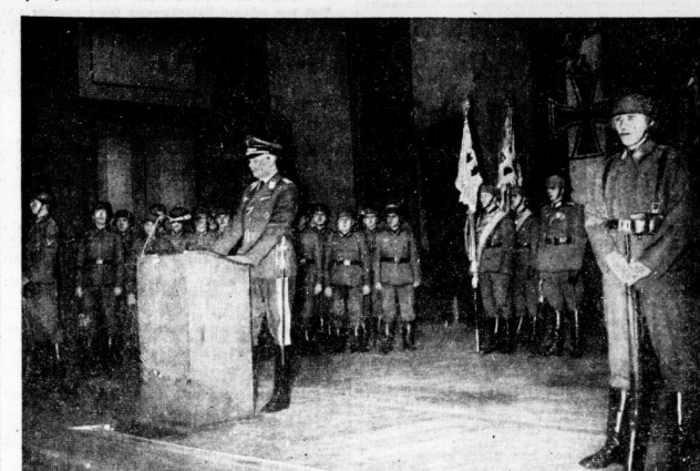
Der halbische Standortälteste, Generalleutnant Schwub, sprach bei der militärischen Heldengedenkfeier im Stadttheater Halle.