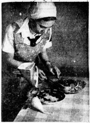
Bei der Herrichtung einer Platte