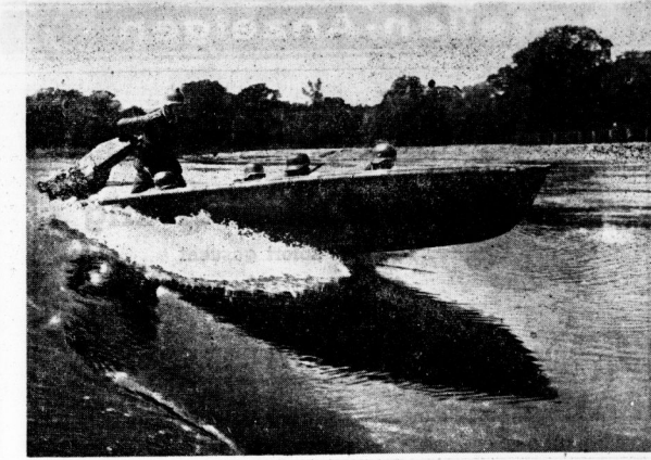
In saussender Fahrt über den Fluß.

Nachdem die Sturmboote ihre Aufgabe erfüllt haben, werden sie durch die Besatzung gesammelt und in Sicherheit gebracht. Die deutschen Pioniere sind stolz auf ihre erfolgreiche Aktion.