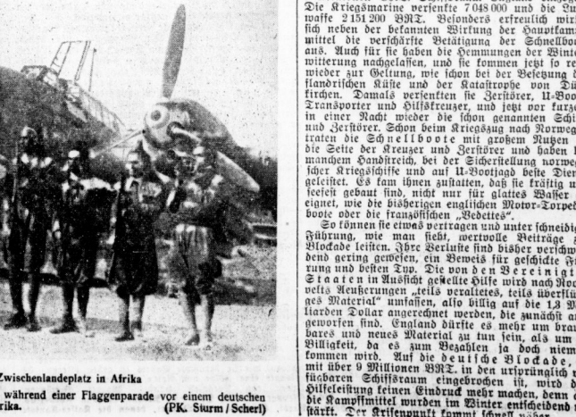
Unser Bild zeigt italienische Eingeborene-Soldaten während einer Flaggenparade vor einem deutschen Kampfflugzeug auf einem Zwischenlandeplatz in Afrika.

Wenn weniger Wachen könnten die deutschen Wehrmachtseinheiten folgende Kriegsanstellungen erlauben: Luftangriff gegen einen Hauptplatz auf Island, Gleitschiff 500 Kilometer westlich Island durch Kampfmittel transportiert, Gleitschiff mit 14 Schiffen im Atlantik durch U-Bootstreitkräfte vertrieben, Gleitschiff durch Luftkampfmittel geleitet. Das sind die Beispiele einer See- und Luftschiff-Blonde, die man sich einmal auf der Karte anschauen muß, um den ersten Eindruck zu gewinnen. Dazu die sichere Überführung von Transportmitteln nach Island und ein Monatsergebnis von 740.000 BRT. Gleitschiff und der Einmarsch in Bulgarien. Das Ergebnis hat begonnen.