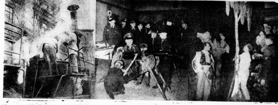
Großfeldküche vor dem Stadtschützenhaus. — Begeisterte Jugend am MG. — Vorbereitungen zur Soldatenrevue im Thalia-Theater.

Am ersten Tage mehr als 3000 Portionen, „ausverkauft“ — Waffen- und Beuteausstellung und vielseitige Darbietungen