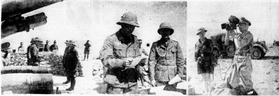
Von links nach rechts: Ferntrauung auf dem Gefechtsstand in der Wüste; der Kommandeur verliest die ungewöhnlichen Vorgänge; (Aufnahmen: Schlösser)

Festakt bei einer in Afrika eingetragenen Truppe unserer engeren Heimat - Trauung auf dem Gefechtsstand - Hochzeitszug und Hochzeitsfeier