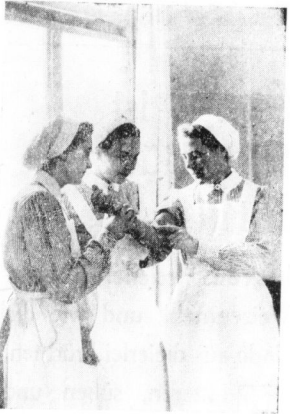
Zwei Helferinnen lassen sich von ihrer Kameradin die Stelle zeigen, an der von Arzt das Blut entnommen wurde.