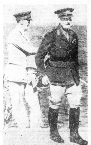
General Wavell in Griechenland General Wavell, einer der Drahtzieher bei den Unternehmungen in Belgien und Athen, führt das Kommando über die britische Expeditionsarmee in Griechenland.

Der Feind empfindet in Tokio für eine vierstündige Wehrmacht die 14. Frontaufmarsch, die zur Zeit der Wehrmachtstrennung in Tokio anwesend sind.