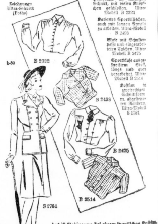
...hat sich... ...hat sich... ...hat sich...