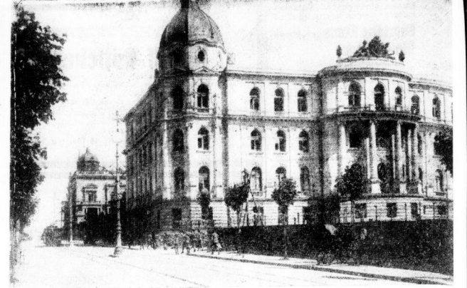
Das Belgrader Königschloß.