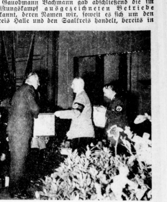
Gaulleiter Eggeling bei der Verleihung der Gau...