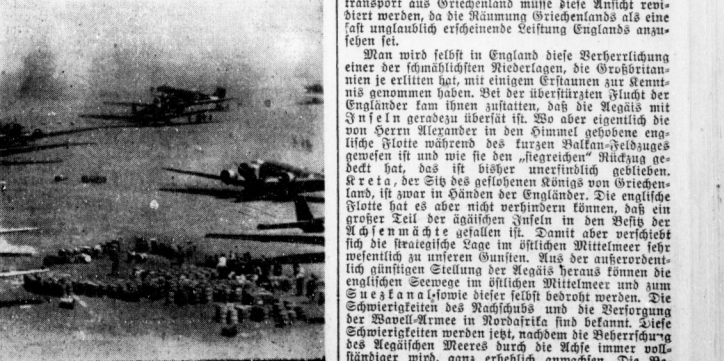
Hochbetrieb auf einem nordafrikanischen Flughafen Auf diesem Nachschubbahnhof herrscht ein ewiges Kommen und Gehen. Die bis in die vordersten Linien fliegenden Maschinen hinterlassen bei jedem Start und bei jeder Landung eine Wolke von Sand und Staub. Im Vordergrund zwei Messerschmitt-Zerstörer, die als Jagdschutz mit den Transportern eingesetzt sind.

Das brasilianische Außenministerium teilt mit, daß das Gebäude des brasilianischen Konsulats in Hamburg bei dem letzten britischen Luftangriff schwer beschädigt sei.