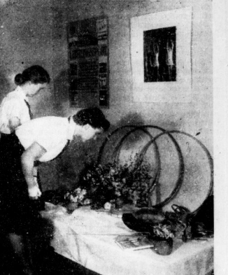
Sporthäute künden von vielseitiger Leibesbetätigung