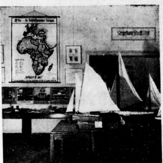
Ausschnitt eines Ausstellungsrahmes