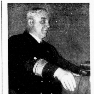
Konteradmiral Lüchow