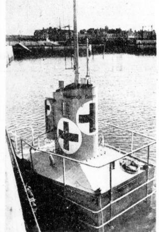
Seenotboje für unsere Flieger

Der Mordtodes entließ sich zu einem Manöver, das, nach neutralen und auch nach englischen Urteil, kaum eine andere Flotte mit im schweren Kampf und noch dazu in getrimmter Linie, ohne Verluste des Zusammenhalts, fertigbekommen hätte. Admiral