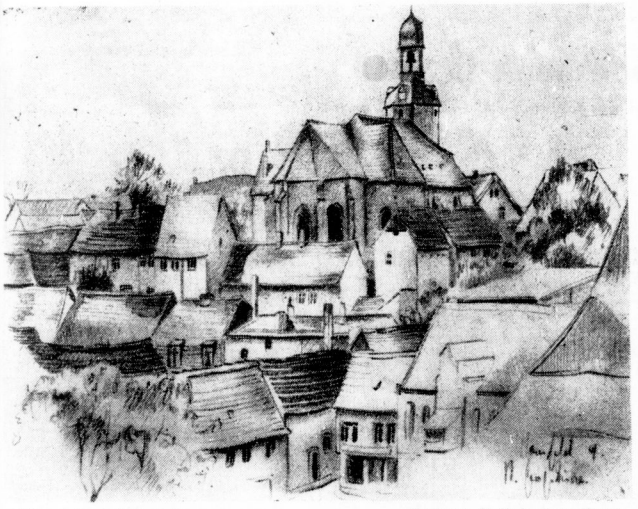
Blick auf die Stadt Mansfeld (Zeichnung: H. H. Jungbauer-Haupt)

Das Mansfelder Land mit seinen Schächten, Gärten, Seen und Höhen ist der „Kaiserschlag“ Mitteldeutschlands. Seit Jahrzehnten fährt in unermüdlichem Eifer der Mansfelder Bergmann auf Schöpfung. Er kennt kein Wert und keine Schätzung.