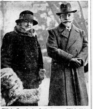
Wilhelm II. und seine Gattin

Der November 1918 und der Herrschaft des Kaisers nach Holland waren das Ende der Wilhelmianischen Epoche. Deutschland führte in tiefer Ohnmacht und Verwirrung. Die große Niederlage, die die deutsche Nation erlitten hatte, sollte jedoch noch dem inneren Geist der historischen Gerechtigkeit, wie es das tapfere und heilige deutsche Volk für sich anerkennen konnte, nur eine epische Blüte. In den Schicksalen des großen Arztes, in denen deutsche Soldaten in allen Teilen der Welt kämpften, wurde jene Gemeinschaft geboren, deren Wiederbelebung aus dem Bewußtsein des gelamten Volkes heraus zunächst und Ziel der nationalsozialistischen Bewegung geworden ist. Das Erlebnis des Weltkrieges bestimmte Adolf Hitler, der als einfacher Soldat in den Millionenreihen der grauen Front stand, zu dem Entschluß, Politiker zu werden und damit die deutsche Nation zu befreien und zu erlösen. Er führte das deutsche Volk aus seinem tiefsten Dorn zu hohen neuen Siegen, die den Bestand des Reiches für immer sichern werden.