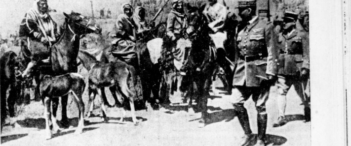
General Dentz, der französische Oberkommandierende in Syrien. Der Oberbefehlshaber der französischen Truppen, die gegenwärtig in Syrien und Libanon. Unser Bild zeigt General Dentz bei einer Besichtigung kurdischer Reiter in Syrien.

Wasserschiffe in England Genf, 14. Juni. Die „Daily Mail“ teilt mit, dass die britische Regierung die Wasserstraßen in England durch Wasserminen absichern wird.