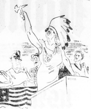
Frau Roosevelt auf dem Kriegspfad: Senator Lee sagte, der Versailler Vertrag war zu traumhaft. Und der wurde von Männern gemacht. Well, den nächsten Friedensvertrag soll man daher nicht lassen!