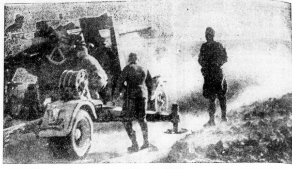
Harter Kampf vor Tobruk. Das vordere Geschütz ist auf den Feind gestossen. Krachend verläßt Schuss am Schuß das Rohr, um die Nacht des sich zurückziehenden Gegners niederzukämpfen.

Im ganzen gesehen, bietet die Uniformierung der deutschen Wehrmacht von heute das Bild einer organisch gewachsenen Ausgestaltbarkeit, die der fortschreitenden Vervollkommnung des Waffens entspricht, und ist im Besonderen in der Wehrmacht zum Begriff eines nationalen Ehrenkleides geworden.