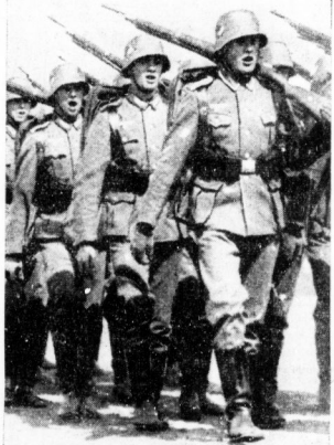
Infanteristen unserer Wehrmacht in ihren zweckmäßigen und kleidsamen Uniformen. (Scherer)

Im Jahre des Neubaus des preussischen Heeres nach 1806 wurde die Uniform grundlegend umgestaltet. Den Hock erhielt der Hock mit aufrechten offe-