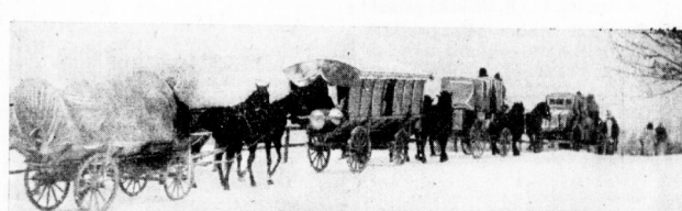
Die Komödianten kommen. Szene aus dem Bavaria-Film „Komödianten“