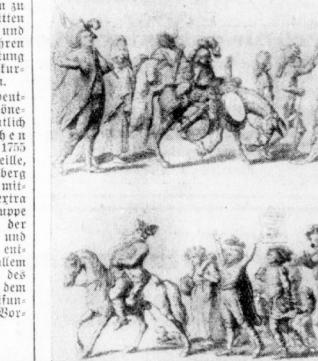
Herumziehende Komödianten. Stich von D. Chodowiecki