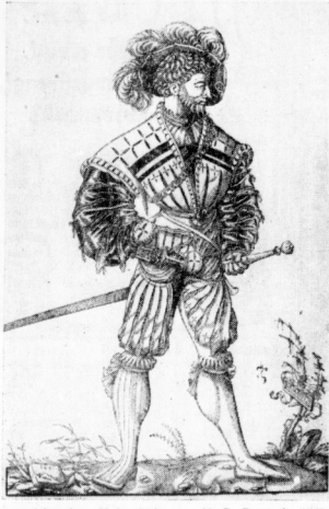
Landsknecht. Holzschnitt von H. R. Deutsch, 1547