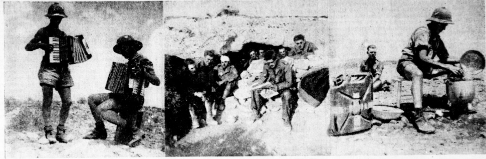
Mitteldeutsche Soldaten in der nordafrikanischen Wüste

Nächtliches Wüstenabenteuer mit unheimlichen Fahrgästen - Ein Flaksoldat vom Saalestrand erhält das EK.