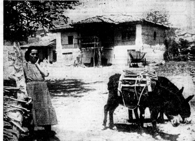
In einem Dorf in Nordbulgarien.

Der junge Soldat hat eine Melodie auf den Lippen. Der Schalter vor ihm leuchtet. Er hat ein Bild vor sich, das er nicht sehen darf. Er hat ein Bild vor sich, das er nicht sehen darf.