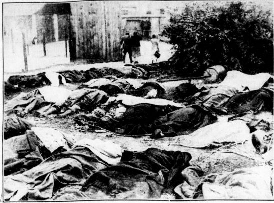
Unbeschreibliche Gräueltaten der Bolschewisten

Nach dem Einmarsch der deutschen Truppen in Lemberg wurden grauenhafte Verbrechen der Sowjets aufgedeckt. Tausende von Ukrainern, die von GPU-Kommissaren verhaftet worden waren, sind von bolschewistischen Unternehmern vielmals ermordet worden. Unser Bild zeigt eine Anzahl der noch vorliegenden Leichen, die am Fuß der Keller der Geläugnisse lagen. Im Hintergrund Angehörige der Ermordeten, die von einem ihnen hilfreich zur Seite stehenden Soldaten von dem Schreckensort weggeführt wurden.