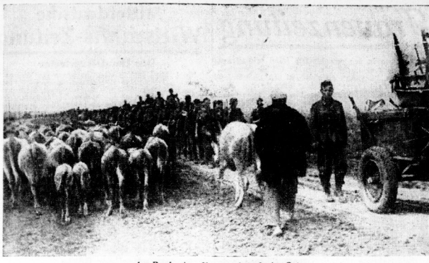
Am Rande einer Vormarschstraße im Osten Oft treffen unsere Truppen an den Vorkampflinien, hinter den Herden auf kleinen Panzerwagen Familie und Habe der ukrainischen Flüchtlinge, die nun im Schutz der deutschen Wehrmacht in ihre Heimat zurückkehren.

Das nächste Dienstprogramm kann vor kurzem der Deutschen Reichsbahn begeben. In der Reichsbahn-Dienstprogramm kann vor kurzem der Deutschen Reichsbahn begeben. In der Reichsbahn-Dienstprogramm kann vor kurzem der Deutschen Reichsbahn begeben.