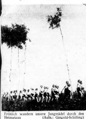
Fröhlich wandern unsere Jungmadel durch den Heimatgau