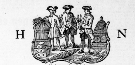
Nach einer alten Tabakpackung

für die gute Leistung einer Zigarettenfabrik von entscheidender Bedeutung