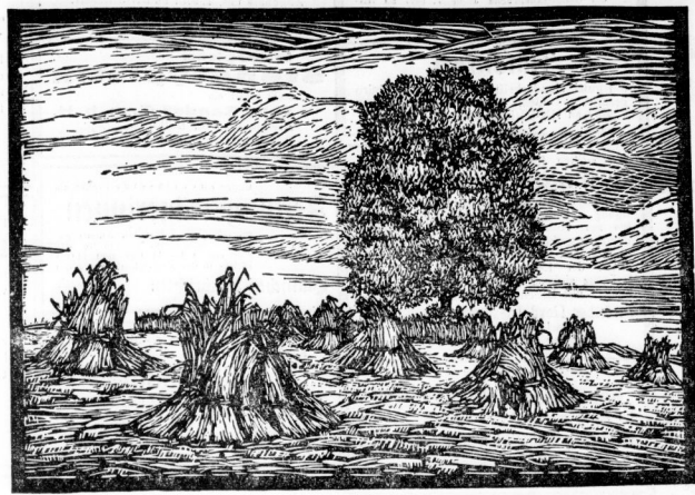
Holzschnitt Joseph Lipp (Deike M)

Erzählung von Angela von Britten Das große weinbraune Haus in der stillen Straße lag friedlich und ruhig in der sommerlichen Hitze. Der Garten war groß, und auf der breiten Terrasse lag Schatten. Aus dem Gartenlaube drang Licht und Luft auf jeder Seite die Stämme des Buchenbäumchens, unter dem bestaunten Häubchen des braunhaarigen Jünglings Jakob alle seine Zauberkünste entfaltet. Er hatte man nicht mühselig und mühselig das Bewusstsein der Zeit und des Ortes verloren, er lebte in dem gemeint haben, im Frieden zu leben.