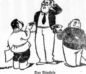
Das Bündnis Stalin und Churchill an Roosevelt: 'Wir bitten gemeins...