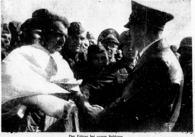
Der Führer bei seinen Soldaten. Der Führer und Oberste Befehlshaber der Wehrmacht begrüßt auf einer Fahrt an die Front einen verwundeten Soldaten.

Bagdad, 27. September. (Gig. Drahtbericht.) Die Agentur Wanda Arabo teilt mit, daß in verschiedenen Teilen Bagdads trotz des Verbots der öffentlichen Versammlung die Demonstrationen der muslimischen Partei als heftigste in der Stadt abgehalten werden. Die Demonstrationen sind heftig und werden von den Briten verboten. Die Demonstrationen sind heftig und werden von den Briten verboten. Die Demonstrationen sind heftig und werden von den Briten verboten.