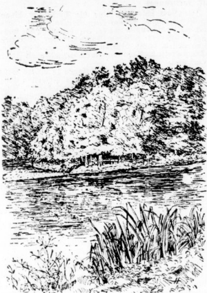
(Schönung: St. 261)