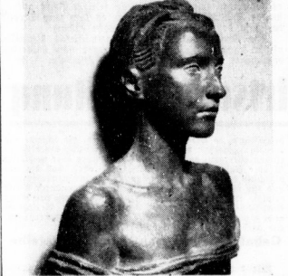
Edgard Hobbing: Mädchenbüste

Verdunklungszeiten am 29. September: Sonnenaufgang 6 Uhr 56 Min. Mondaufgang 15 Uhr 56 Min.