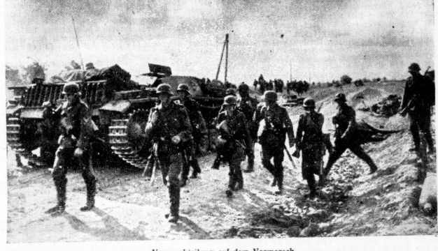
Vorausabteilung auf dem Vormarsch. Begleitet von den Sturmgeschützen geht die Vorausabteilung immer tiefer in das feindliche Gebiet hinein. Rechts und links der Straße liegen die Reste zerschlagener sowjetischer Verbände.

Wiederum hohe Feindverluste. Berlin, 8. Oktober. Der Monat September leistete für die deutsche Luftwaffe wieder mit keiner Ausnahme ein hervorragendes Ergebnis. Während ihrer gefährlichen Kampfbereitschaft in den Monaten vorher und mit sehr viel geringeren Kräften am Kanal angriffen, ist ihr Gebiet etwas eingesenken, aber nach Norden vorzugeschoben. Die deutschen Jäger, einfindelich der Weichersbuden, die flieg, die Marine-Flieger, ja sogar die Jäger, die Nacht im Weichersbuden, haben sie so tötlich ab, daß insgesamt 308 britische Fugzeuge abgeschossen wurden.